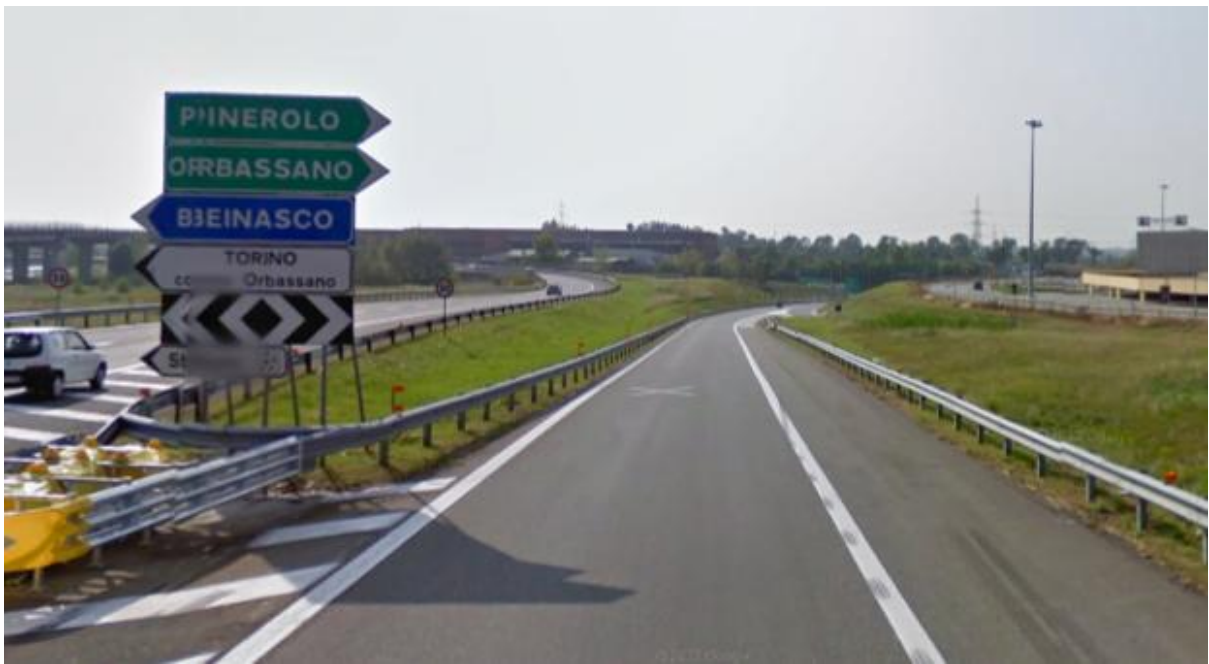
Entri nella A55...